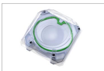
BX-10 エクストリームスタジアム 1台