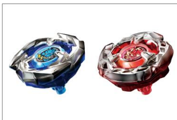
ドランソード3-60F 青 ヘルズサイズ4-60T 赤