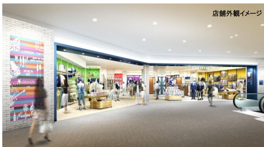
店舗外観イメージ

ORIHICAは、1都3県の出店を強化しています。なかでも埼玉県は2014年度で3店舗を出店し、ドミナント化を推進しているエリアです。このたび、集客力の高い商業施設「ららぽーと」の新規開業店舗に出店することにより、幅広い層へのアプローチを図り、より一層の認知度向上をめざします。