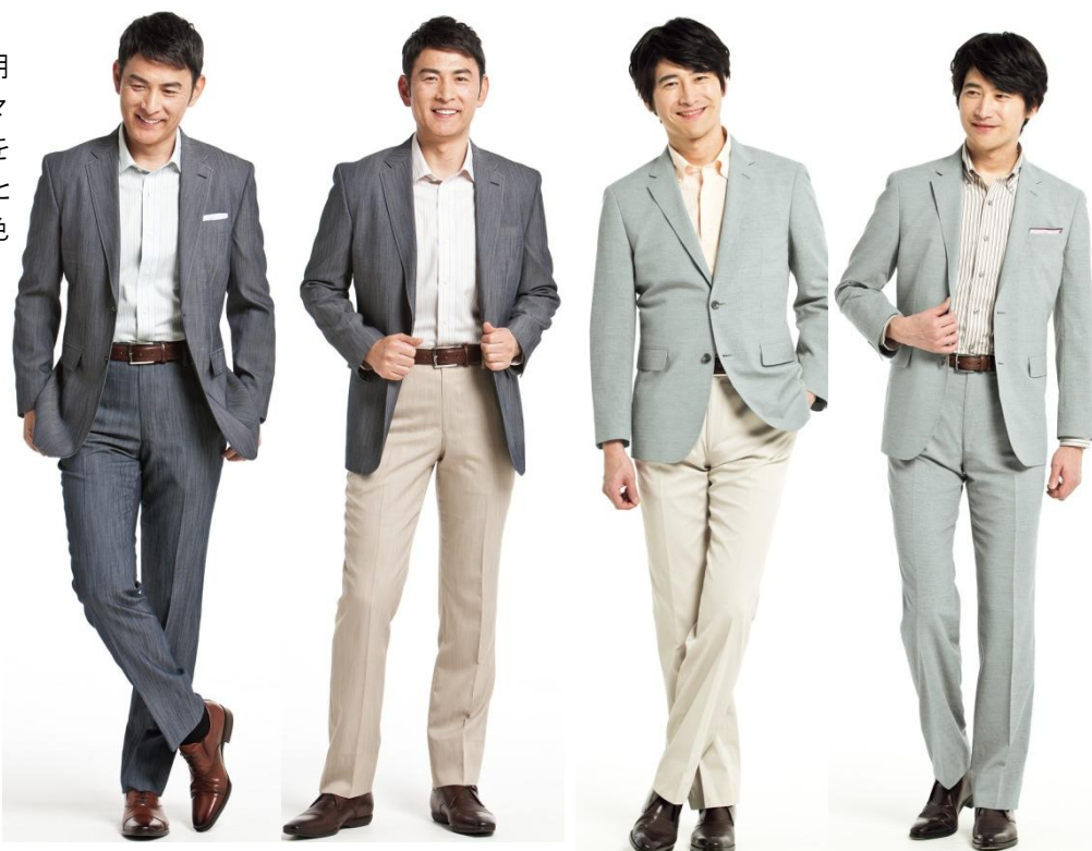
エレガンスシャンプレーストレッチジャケット