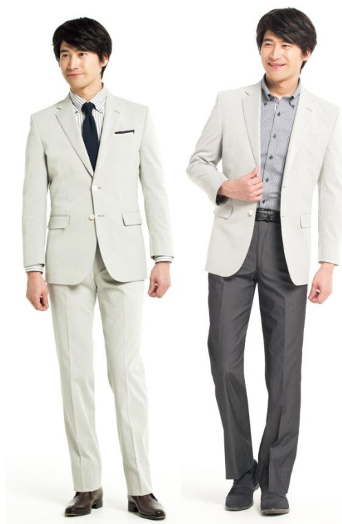
コードレーンサッカーストレッチジャケット