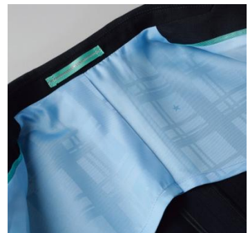
CanCamコラボ(ネイビー)の裏地

トレンドのチェック柄に星マークが隠れたデザイン。エメラルドグリーンをイメージしたオーガンジーのパイピングでエアリー感を表現。