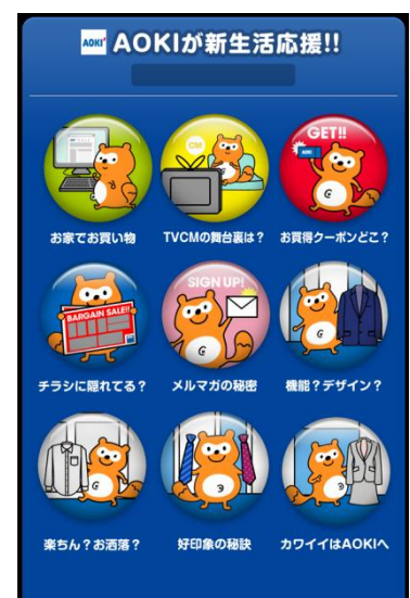
バッジコレクション イメージ

ユーザーは、AOKIのウェブサイトへのアクセスやボーナスコードの入力など、特定のアクションをすることで、バッジを獲得することができます。