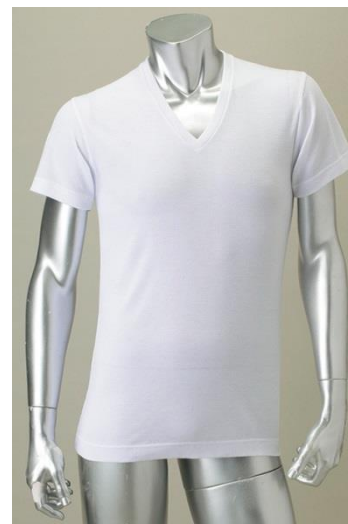
デオドラント5シリーズ 究極デオドラント AOKI涼感肌着