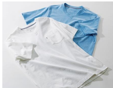
NEW! デオドラント5Tシャツ

柔らかな肌触りと、吸水性に優れた綿素材を使用しているため、汗のべたつきも気にならず、快適に着用できます。