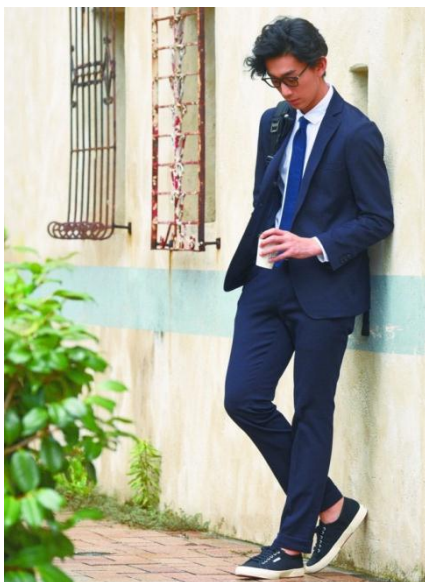
THE 3rd SUITS