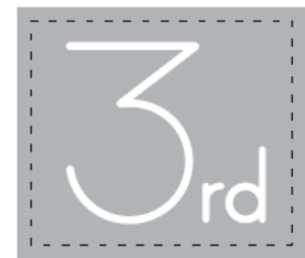
THE 3rd SUITSのロゴ