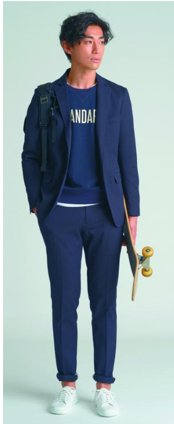
THE 3rd SUITSの着回し例 (左:ビジネススタイル 右:カジュアルスタイル)