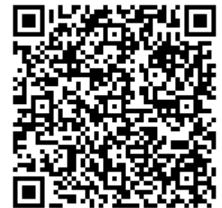
THE 3rd SUITS 動画のQRコード

ORIHICAでは、今後もシーズンテーマである“ネイビー＆ブラック”の世界観を お伝えする動画の配信により、ORIHICAブランドの認知向上を図っていきます。