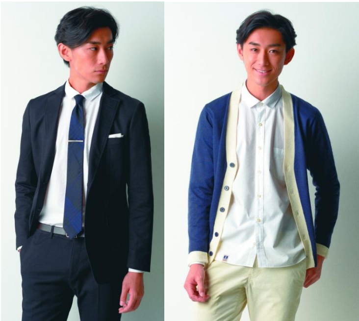
ポップリンシャツの着回し例 (左:ビジネススタイル 右:カジュアルスタイル)