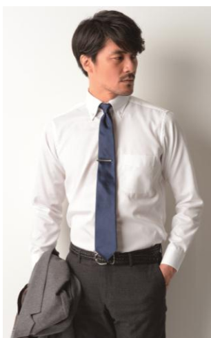
オックスフォードシャツ

縦と横に綿の糸を2本ずつ引きそろえて平織りにした生地(オックスフォード)を使用。 たていとよこいと 経糸に緯糸よりも細番手の糸を使用し、微起毛加工を施しているため、秋冬に最適な厚手の生地でありながらソフトな風合いを実現しています。「ポップリンシャツ」と同じ立体的な型紙を使用した、体にフィットする縫製により、着心地と動きやすさも追求。ビジネスでもビジカジスタイルでも幅広く着回せるアイテムです。