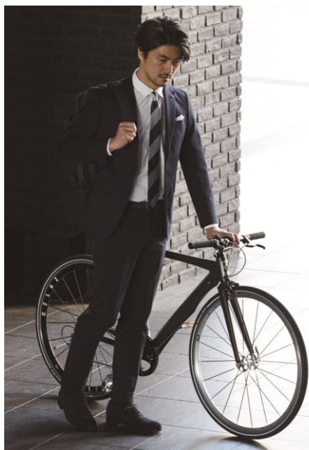
①ビジネス「THE 3rd SUITS」

2016年春夏シーズンに展開する「THE 3rd SUITS」は、ビジネスライン2種類とカジュアルライン2種類の商品を発売。幅広い年代の方に、よりシーンに合わせた着こなしをご提案できる商品をラインアップしています。