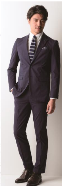
②ビジネス「THE 3rd SUITS」