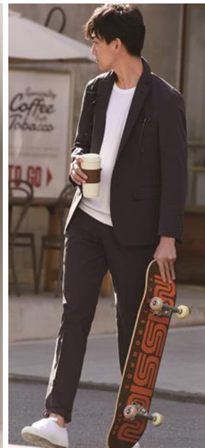
④カジュアル「THE 3rd SUITS」