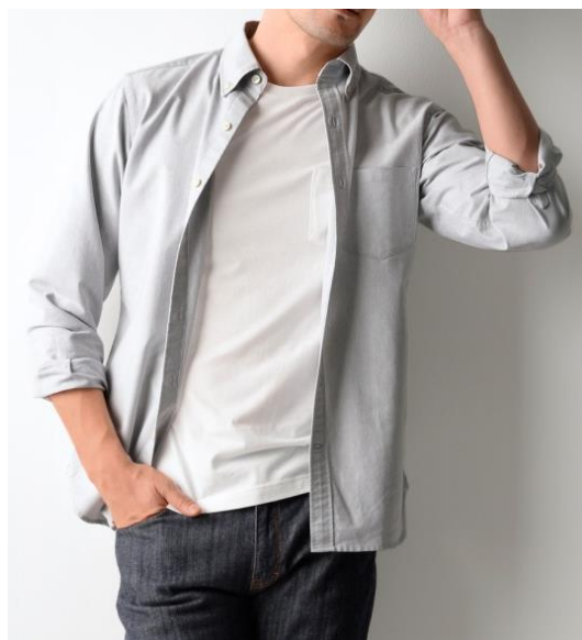
税抜価格 4,900円(長袖・七分袖・半袖)