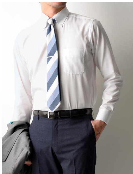
税抜価格 4,800円(長袖)/4,900円(七分袖)