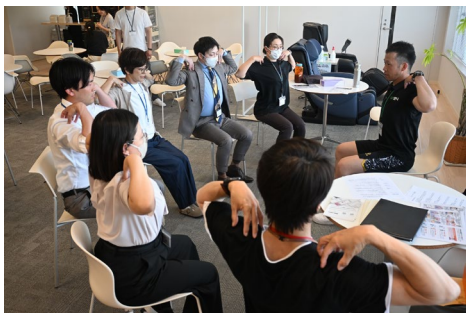
▲FiT24トレーナーによるストレッチアドバイス

ヘルスリテラシーやメンタルヘルスに関する教育機会の提供や、当社グループの株式会社快活フロンティアが運営する24時間セルフフィットネスジム「FiT24」との連携など、グループリソースを活用した健康意識の向上につなげています。