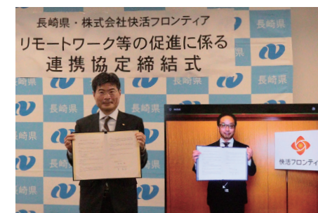
左)長崎県 平田 研副知事 右)快活フロンティア 代表取締役社長 東 英利

今回の取り組みを通じて長崎県における人口減少、地方創生の課題解決に貢献するとともに、快活CLUBの新たな客層開拓と利用シーンの多様化につなげてまいります。