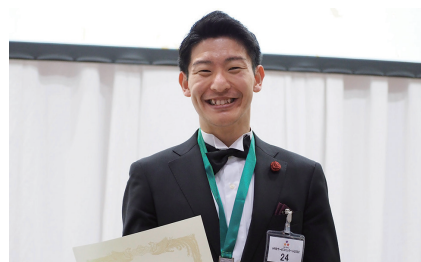
「HRSサービスコンクール2022」にて銀賞を獲得した「アニヴェルセル 表参道」スタッフ

アニヴェルセルでは国際コンクールで優勝経験のあるプロを研修講師に迎えるなど「世界基準のおもてなし」の実現に取り組んでおり、今後もスタッフの技能向上、サービス意識の向上に努めてまいります。