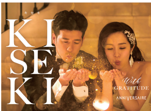
アニヴェルセル10万組感謝祭『キセキ』

お客様へ感謝と祝福の気持ちを届けるために—— アニヴェルセル10万組感謝祭『キセキ』開催