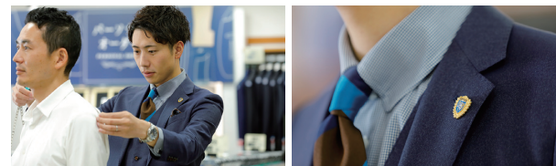
「クイックオーダースーツ(QOS)」イメージ

上下のサイズやスタイルを別々に選べ、オーダースーツのようにピッタリの1着が最短4日で仕上がる新サービス『クイックオーダースーツ(QOS)』。2021年9月より約20店舗でスタート。ご好評いただき、より多くのお客様にご利用いただくため10月には対象店舗を約100店舗にまで拡大しました。