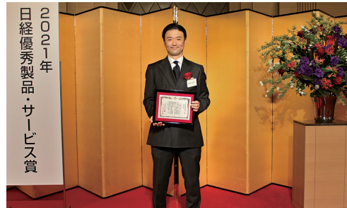
「2021年日経優秀製品・サービス賞」表彰式