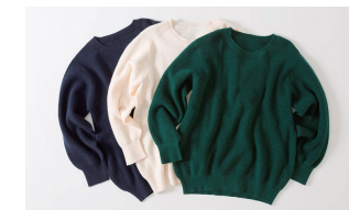
「キレイめもちもちニット」

2020年11月にスタートした、働くママインフルエンサーのお声をもとに新商品開発に取り組む「働くママの理想の1着制作プロジェクト」。第1弾、第2弾に続き、第3弾として2021年11月には『キレイめもちもちニット』、第4弾として2022年2月には『ORIHICAフラミンゴPANTS™』を発売しご好評いただいています。今後も働くママをはじめ、お客様のニーズを反映した商品を開発・販売してまいります。