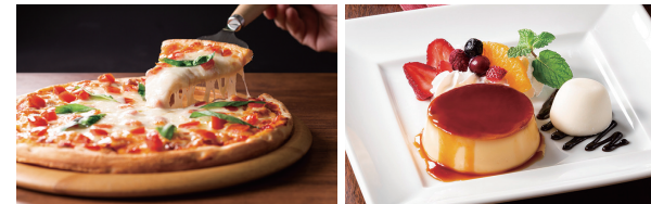
とろ〜りチーズとモッツァレラのマルゲリータ(コート・ダジュール) プリン・ア・ラ・モード〜雪見だいふく添え〜(コート・ダジュール)

「快活CLUB」と「コート・ダジュール」のグランドメニューを改定しました。今回は、快活CLUBの「快カツカレー」、専用釜で焼き上げるコート・ダジュールの本格ピザなど、こだわりある定番メニューに加え、テレワーク中にも片手で食べやすく多様なシーンに合わせたメニューをご用意しました。今後も店舗の魅力さをさらに高めるフード開発に力を入れてまいります。