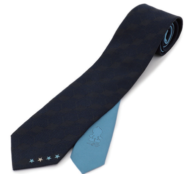
2020年J1リーグ優勝記念ネクタイ

ORIHICAはオフィシャルスーツサプライヤーとして、「フィールド内は戦士、フィールド外は紳士たれ!」をコンセプトに、これまで16年にわたり選手たちにスーツを提供してきました。今後も全力でサポートしてまいります。