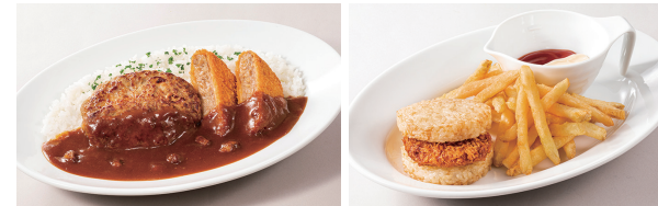
ハンバーグ&メンチカツカレー(快活CLUB) とんかつライスバーガーセット(快活CLUB)