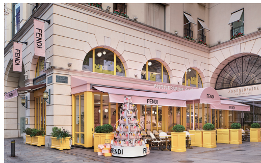
FENDI CAFFÈ by ANNIVERSAIRE

イタリアを代表するラグジュアリーブランド「FENDI(フェンディ)」とのコラボレーションにより、「アニヴェルセルカフェ 表参道」にフェンディの世界観を表現した「フェンディ カフェ バイ アニヴェルセル」を期間限定(2020年11月28日～2021年2月14日)でオープン。期間中は遊び心溢れる空間とともに、お客様にフェンディ家秘伝のレシピをベースに作られたFFロゴ型 Pastaなどの限定メニューをお楽しみいただきました。