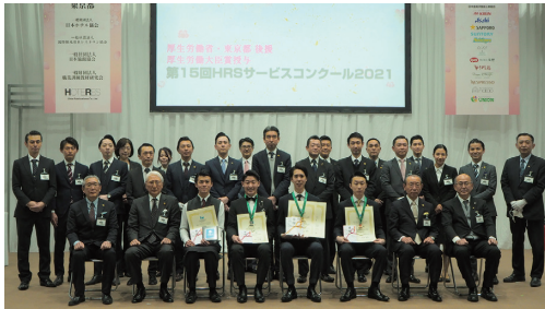
HRSサービスコンクール2021

若きサービスパーソンが技術・技能を競う「HRSサービスコンクール2021」(主催:日本ホテル・レストランサービス技能協会)のヤングプロフェッショナル部門でアニヴェルセルのスタッフが銀賞を受賞しました。企業として3年連続の入賞になります。アニヴェルセルでは、社内での研修をはじめコンクールへの積極的な参加を通じてスタッフのスキル向上に努め、今後も「世界基準のおもてなし」を目指してまいります。