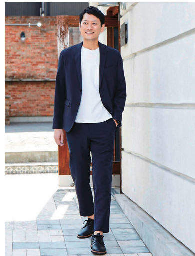
「アクティブワークスーツ™」

「シーンを選ばず気軽に着られるスーツが欲しい」というお客様のご要望を受け、「スーツはもっと自由に。スーツはもっとアクティブに。」をコンセプトに『アクティブワークスーツ™』を開発。立体縫製技術などスーツ専門店の強みを活かし、高品質・高機能でありながらお手頃価格を実現しました。多くのお客様からご支持をいただき、発売2カ月で販売着数7,000着を突破。今後もお客様のライフシーンに合わせた商品を企画・開発してまいります。