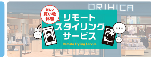
(左)チャットスタイリングサービスイメージ (右)リモートスタイリングサービスイメージ