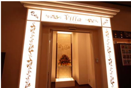
セキュリティーゲート

共有スペースとセキュリティーゲートで分けられた女性専用エリアは白を基調とした明るく清潔な空間です。今までのインターネットカフェのイメージを払拭する「女性だけの安心空間」をご用意しました。待ち合わせ前のメイク直しや時間調整にご活用いただけます。また、読みたかったマンガを思いっきり読む、観たかった映画や動画を思いっきり観る、など周りを気にせずに自分だけの時間をお過ごしいただけます。