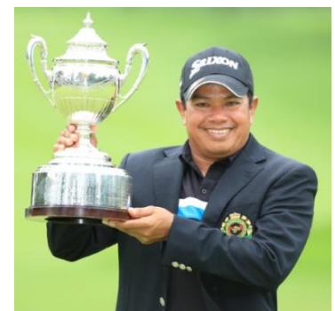
「日本シニアオープン」 プラヤド・マークセン選手(所属:フリー)