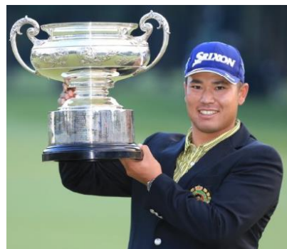
「日本オープン」 松山 英樹選手(所属:レクサス)