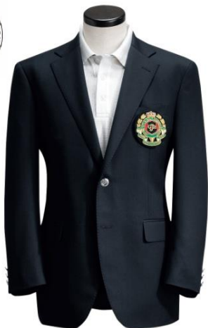
AOKI「JGA公認 チャンピオンブレザー レプリカモデル