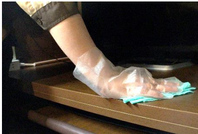
【次亜塩素酸ナトリウム消毒液による清掃】