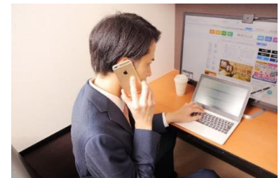
【周りを気にせずに利用できる】 オートロック付の鍵付完全個室 室内コンセント、USB充電、Wi-Fi 完備