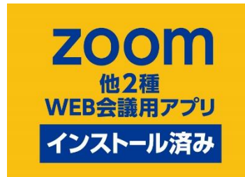
【WEB 会議用アプリ導入】 鍵付完全個室の全席で利用可能