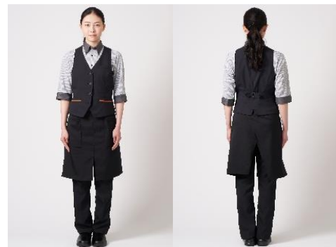
女性着用イメージ