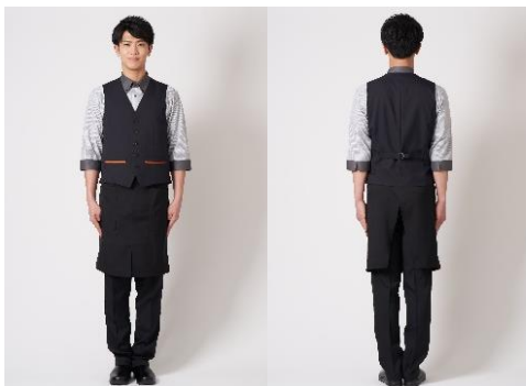
男性着用イメージ