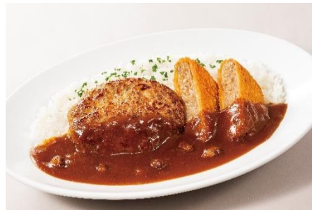
ハンバーグ&メンチカツカレー 700 円(税込 770 円)