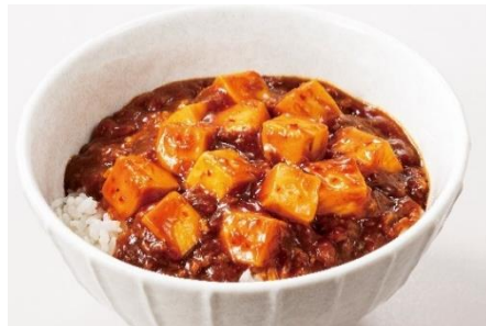
麻婆豆腐丼ランチ

バリエーション豊富な 5種類から選べる！ ワンコインランチ 各 500 円(税込 550 円)