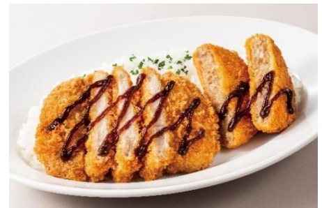
豚カツ& メンチカツランチ

※一部店舗ではお取り扱いのないメニューがございます。詳細は https://www.kaikatsu.jp/shop/ よりご確認くださいませ。 ※本リリースに掲載されているメニュー写真はイメージです。