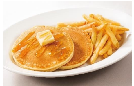
パンケーキランチ