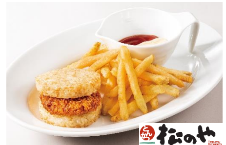
とんかつライスバーガーセット 500 円(税込 550 円)

快活CLUBでは「食の安心安全宣言」を掲げ、次亜塩素酸ナトリウム消毒液による各所の清掃や食器・ガラスの手洗い後に高圧洗浄機をかける2度洗いの実施等を徹底しております。