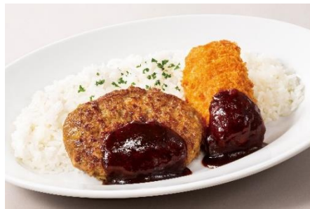
ハンバーグ& かにクリームコロッケランチ

ボリューム満点！ 人気メニューを 集めたワンプレートランチ 各 555 円(税込 610 円)