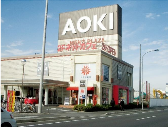
快活CLUB第1号店(14号幕張西店) AOKI店舗の遊休スペースを活用して出店

快活CLUBは、2003年7月に千葉県に第1号店を出店。「極上のリラックスをもっと手軽に」をストアコンセプトに、おかげさまで今度日本全国に497店舗を展開させていただく事になりました。