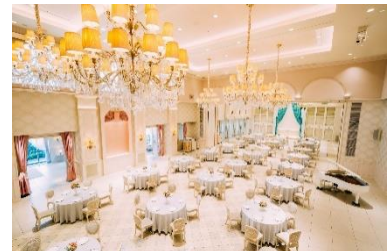
イベント・パーティ