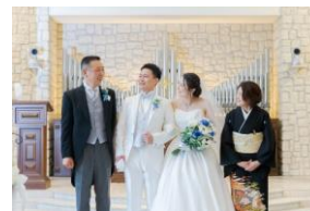
キセキのエピソード

■アニヴェルセル創業からのあゆみ「ヒストリー」 https://kiseki.anniversaire.co.jp/history