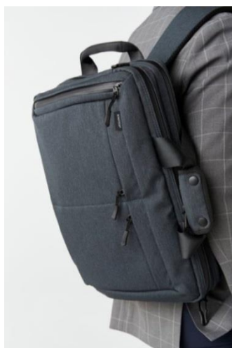
MINOTECH®ファブリック3WAYバッグ

株式会社AOKI(代表取締役社長:諏訪健治)が展開する『ORIHICA』は、ビジネスパーソン オリヒカ の必需品であるビジネスバッグに高機能素材を使用。多機能バッグとして新発売します。バッグの持ち手を変えるだけで普段の仕事にも出張にも使える3WAY、4WAYバッグが新登場。毎日忙しいビジネスパーソンにハードに使っていただける商品をORIHICA全店並びにオンラインショップにて発売いたします。