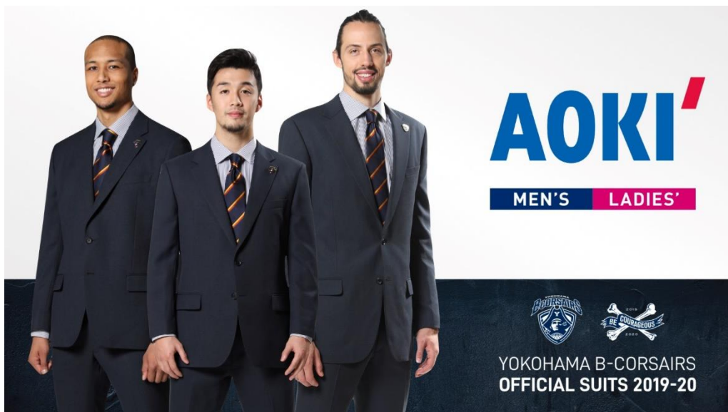
横浜ビー・コルセアーズ 2019-20オフィシャルスーツ / ©B-CORSAIRS