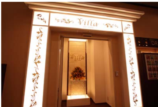
セキュリティーゲートイメージ

共有スペースとセキュリティーゲートで分けられた女性専用エリアは白を基調とした明るく清潔な空間です。今までのインターネットカフェのイメージを払拭する「女性だけの安心空間」をご用意しました。待ち合わせ前のメイク直しや休憩はもちろん、読みたかったマンガを思いっきり読む、観たかった映画や動画を思いっきり観る、など周りを気にせずに自分だけの時間をお過ごしいただけます。