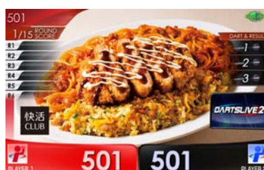
トルコライステーマ