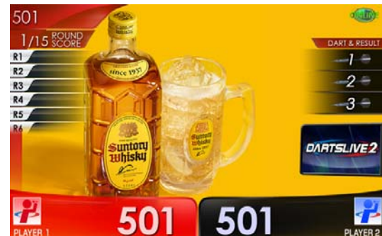
角ハイボールテーマ