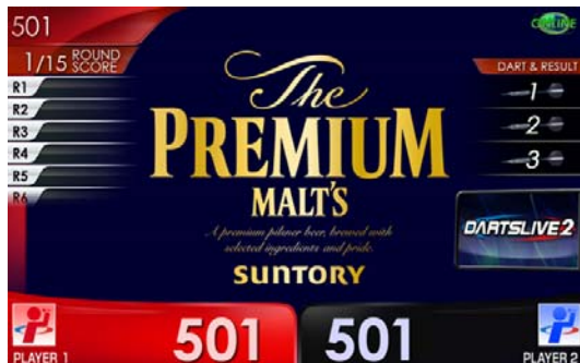
ザ・プレミアム・モルツテーマ