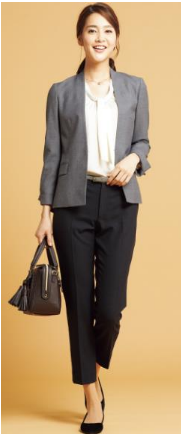
Business Trip フラノセットアップ (ジャケット 本体価格(税抜)19,000円) (パンツ本体価格(税抜)9,000円) 展開カラー：ネイビー無地、グレー無地 サイズ : 3S~3L

株式会社AOKI(代表取締役社長：中村宏明)は、働く女性の増加とともに、お客さまから多くのご要望をいただいている「洗える・防シワ・伸びる」といった高機能商品の企画を強化。秋冬の新作商品を『はたラク服』として、AOKI全店舗ならびにオンラインショップにて発売します(2017年10月4日現在 AOKI店舗数 571店舗)。