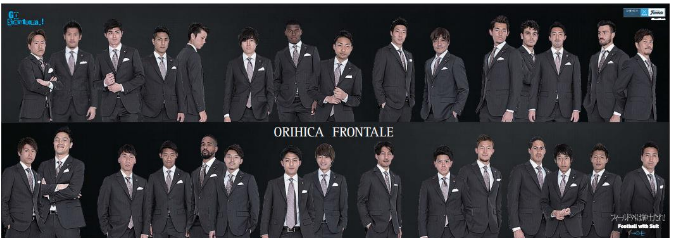
A3ワイドサイズ集合写真ポスターイメージ図