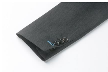
②チームカラーをボタンホールに施す