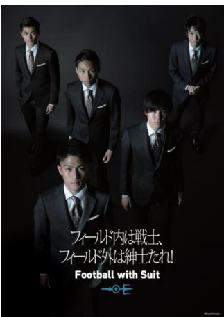
店舗告知ポスターイメージ図