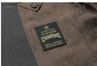
③ジャケット内側に施したオリジナルネーム