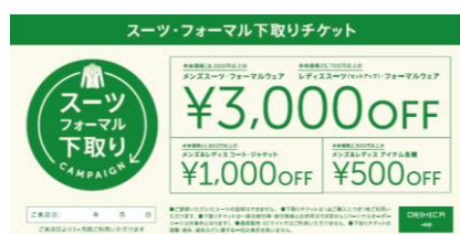
下取りキャンペーン チケット画像

お客様から「着られなくなったスーツを捨てるのは忍びない」との声を多数伺い、『AOKI』でも実施していた下取りサービスをORIHICAでも実施。今年1月のキャンペーンでは約1か月の短い期間にもかかわらず、クーポン利用の売上高計画比が120%で推移し、お客様にご好評をいただきました。秋の衣替えシーズンはクールビズ終了やブライダル・パーティーフォーマル需要の増加など、スーツ・フォーマルが必要となる機会が多くなります。本キャンペーンでは、ご不要になったスーツ・フォーマルを店頭にお持ちいただくと、1点につき1枚商品割引チケットをお渡しし、下取りアイテムはウール・エコサイクル・プロジェクトとして緑化資材やモップ、手袋など様々なリサイクル製品に再生・再利用します。最大で3,000円割引となる下取りチケットを有効活用することで、秋の新作商品もお値打ちにご購入いただけます。下取りキャンペーンにより、不要となったウール衣料を回収し、ビジネスライフ充実のための新たなファッションを商品・サービス・接客でご提供してまいります。