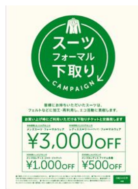
下取りキャンペーン ポスター画像

(※未実施店舗：市川コルトンプラザ店、水戸エクセル店、那須ガーデンアウトレット店、三井アウトレットパーク仙台港店、新静岡セノバ店、神戸ハーバーランドumie店、イオンモール神戸北店、ニッケパークタウン加古川店)