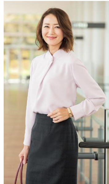
AOKIウーマンスタイル スタyling例