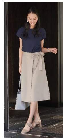
単品コーディネート