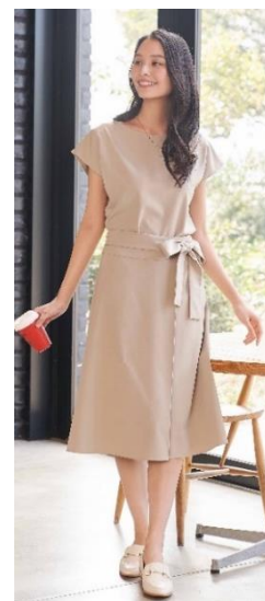
ワンピース風コーディネート

ビジネスシーンでの服装の変化に加え、クールビズのシーズンは特に服装が軽装化されるため、どのようなスタイルが正解かわからないというお声を多くいただきます。ORIHICAの「らくちんセットアップ」は同素材を使用した、ワンピース見えるカットソー・スカートのセットアップと、クールな印象のシャツ・パンツのセットアップの2スタイルをご用意しており、簡単にきちんと見える装いを叶えることができる商品です。シンプルなデザインなので単品でも着回すことができ、さまざまなアイテムに合わせることができます。機能面でもシワになりにくく、自宅の洗濯機で洗えるためケアも簡単。コーディネートがすぐに決まり、お手入れにも時間がかからないため時短になり、忙しい毎日でも時間を有効に使うことができます。本商品を通して、ORIHICAは働く女性の毎日を応援いたします。