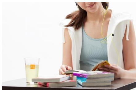
快活CLUBのコミック・雑誌・ドリンクバーのご利用が1日1回1時間無料

「快活CLUB」併設なので、施設の相互利用をはじめ、充実したアメニティやサービスをご用意しております。