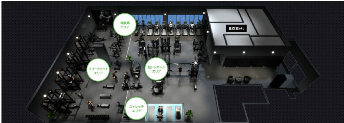
パース・設置マシンはイメージです。実際とは異なります。