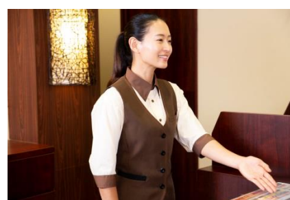
快活CLUBスタッフが24時間対応 (ジムスタッフ対応時間は11:00～20:00)