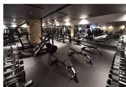
ウエイトトレーニングマシン