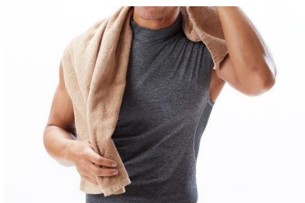
バスタオル・フェイスタオルのご利用が無料