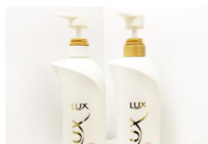
シャンプー・ボディソープが無料で利用可能 ※店舗により取り扱い銘柄が異なる場合がございます。