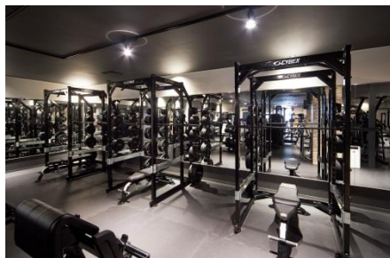
フリーウエイト機器