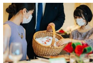
お酌廻りに代わる プチギフト