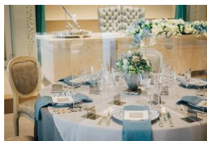
バンケット用 アクリルパーテーション