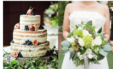
おふたりの理想の結婚式が、 どんどん形になっていく