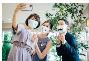
オリジナルマスク