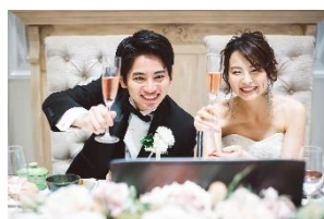
オンラインウエディング