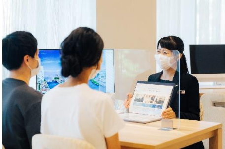
会場でフェア体験！安心・安全フェア