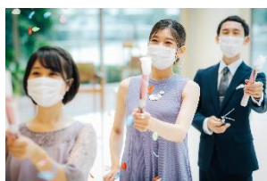
クラッカー型 フラワーシャワー