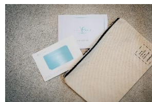
STYLISH e-gift (カード型3点カタログギフト)