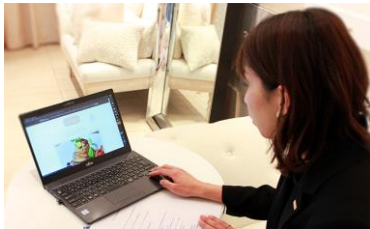
いつでも、どこでも、気軽に、 結婚式の準備ができる