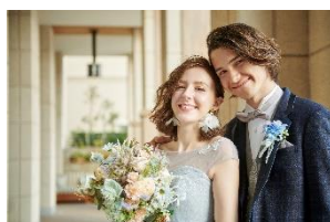
披露パーティのみウエディング