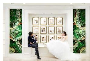
フォトウエディングプラン