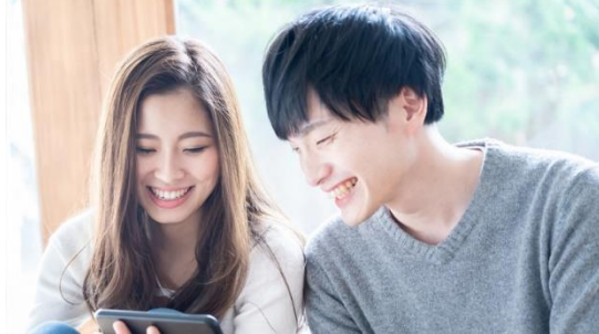
自宅でフェア参加！オンライン相談会