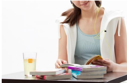
快活CLUBのコミック・雑誌・ドリンクバーのご利用が1日1回1時間無料

「快活CLUB」併設なので、施設の相互利用をはじめ、充実したアメニティやサービスをご用意しております。