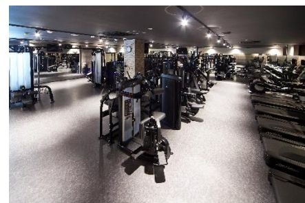
ウエイトトレーニングマシン