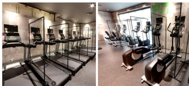
【FIT24 新型コロナウイルス対策】