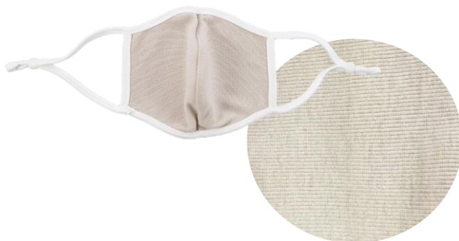
裏地：防汚加工・抗菌加工