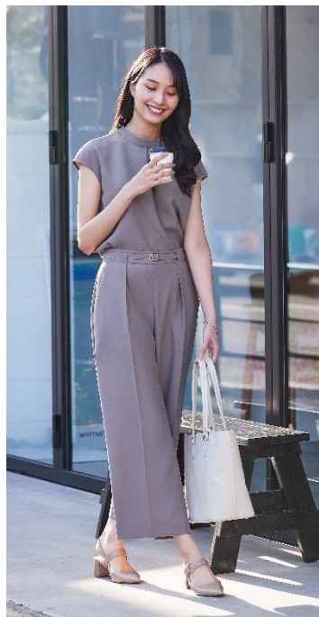
スタンドネックブラウス + ワイドパンツ

茶はブラウス2種類とワイドパンツ・ベルト付きスカートのカセット服での展開。組み合わせを変えるだけで簡単にコーディネートを楽しめます。