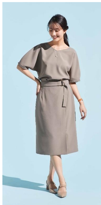
ドルマンスリーブブラウス + ベルト付きスカート