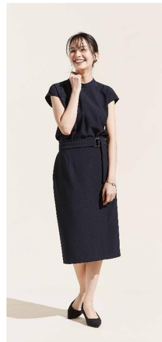
スタンドネックブラウス + ベルト付きスカート