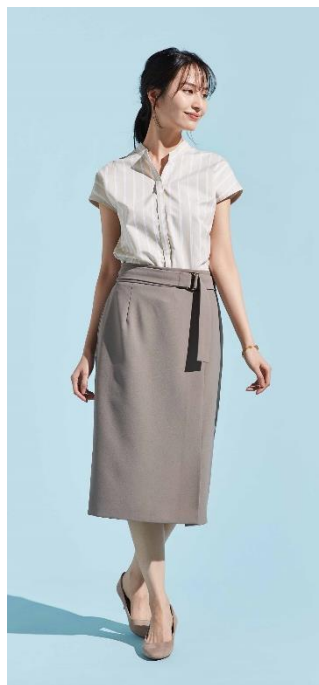
ベルト付きスカート単品