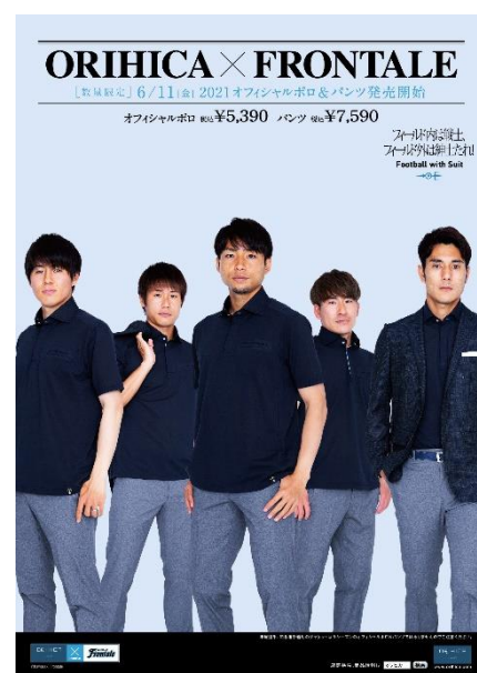
メインビジュアルイメージ

2021年限定のポロシャツは、選手がアウェーゲームなど、移動時に着用するものと同じ商品です。ネイビーベースのビズポロシャツで、吸汗速乾性に優れた素材を使用。フロントを比翼仕様にする事でシンプルなデザインに仕上げているため、お仕事でも着用いただけるデザインです。また、縫製のパターンを変更し、脇ハギを入れることで快適に体に馴染むシルエットを追求しました。襟の内側に「ふろん太」、裾のピスネームに「カブレラ」と獲得タイトル数を表した5つの星をあしらひ、さらに第一ボタンをフロンターレブルーにすることで、さりげなくクラブのカラーを演出しております。フロンターレのサポーターはもちろんのこと、スマートに装いたいビジネスパーソンにも、また、父の日のギフトとしても毎年ご好評の商品です。これからもORIHICAはオフィシャルウェアのご提供を通じて、川崎フロンターレの選手・スタッフをサポートしてまいります。