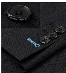
「Frontale x ORIHICA」が刻印されたボタン