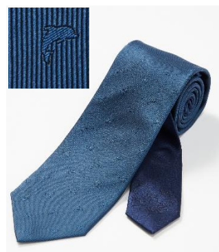
川崎フロンターレエンブレムのイルカをモチーフにした小紋柄

商品名: ORIHICA × 川崎フロンターレ2023オフィシャルスーツ 税込価格: 52,800円 素材: ウール50% ポリエステル50% サイズ: メンズ Y2~BB9 レディース 5~17号 販売数: 限定約180着(メンズ・レディース合計) ※パーソナルオーダーのため数量が前後する場合がございます。