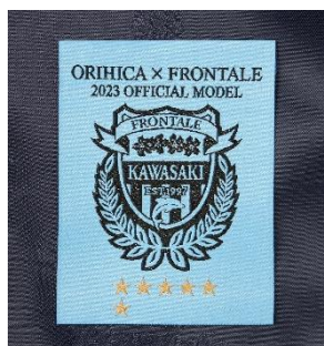
フロンターレカラーとタイトルを表す金刺繍の星が入った織ネーム