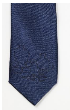
「ふろん太」「カブレラ」「ORIHICAの鍵マーク」