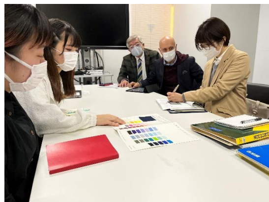
学生とフレックスジャパン株式会社との打合せ風景

これからもORIHICAは、お客様のニーズにお応えする商品をご提供するとともに、ファッション業界を担う次世代デザイナーの育成および、ファッション業界の更なる発展に力を尽くしてまいります。