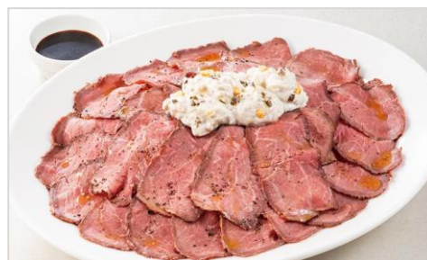
ローストビーフ&ポテトフライ -特製トリュフソース-