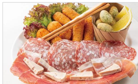
前菜盛合せプレート