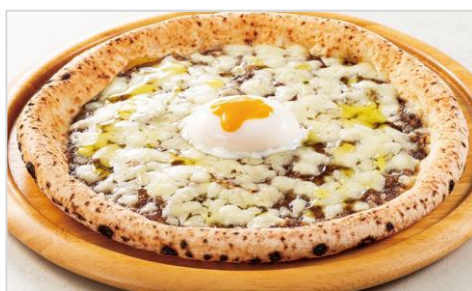
トリュフソースのビスマルクピザ