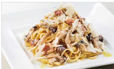
パンチェッタと茸のトリュフクリームパスタ