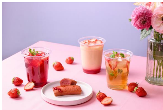
テイクアウトメニュー

テイクアウトドリンクは、イートインとは異なるサイズの専用カップにてご提供いたします