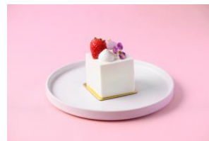
苺のショートケーキ