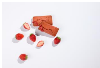
苺のフィナンシェ

自家製の苺ジャムをたっぷり使用し、まろやかな苺の風味と香ばしいバターの香りを一度に楽しめる期間限定のフィナンシェです。