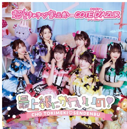
▲コラボパック限定ステッカー

コート・ダジュールは安心・安全・清潔をテーマに時代のニーズに合った個室の利用シーンを提案して参ります。