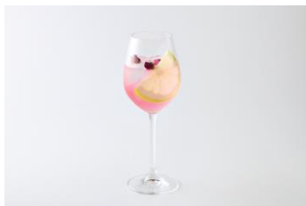
ロゼフルール 1,320 円