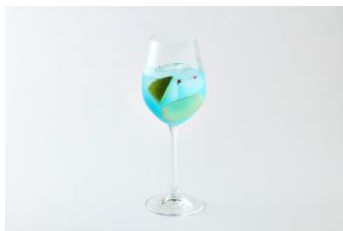
ラメルブルー 1,320 円