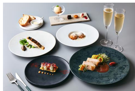
夏季限定ディナーコース

夏限定のコースは、大切な記念日はもちろん、ご家族やご友人とのディナータイムを彩る計6品のフルコースです。エビの旨味を凝縮した濃厚なソースを合わせた海の幸の贅沢なタルト、チーズをふんだんにのせたトリュフ香るライスコロッケ、香ばしくしっとりと焼き上げたスズキのポワレ、塩麹で漬けた柔らかいイペリコ豚のソテーにデザート2種をお楽しみいただけます。