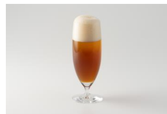
クラフトシャンディーガフ 1,210円 JAPAN ALE<香>使用