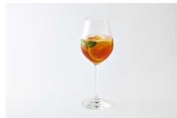
カフェアンブル 1,320 円