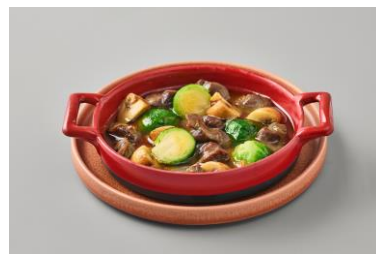
砂肝と芽キャベツのアヒージョ 1,400 円