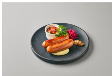
フランクソーセージのグリル マッシュポテト 粒マスタード 1,650 円