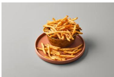
フレンチフライ (スパイシー) 880 円