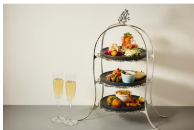
アペタイザースタンド 3,520 円

3段のスタンドで10種類の前菜を味わえる人気のアペタイザースタンドや、夏野菜の旨味たっぷりのズッキーニを丸ごと一本焼き上げたステーキ、素材の旨味が溶け込んだオイルで作る砂肝と芽キャベツのアヒージョなど、シェフが「BEER DINING」のために腕をふるったスペシャルフードメニューを、冷たいアルコールドリンクと合わせてご堪能ください。