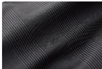
新色: グレンチェック