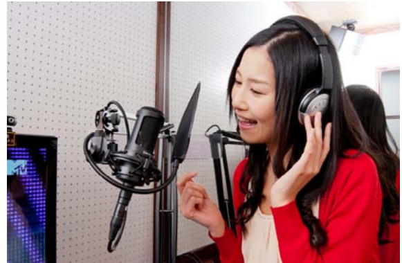
ワンツーカーオケ(3ルーム)