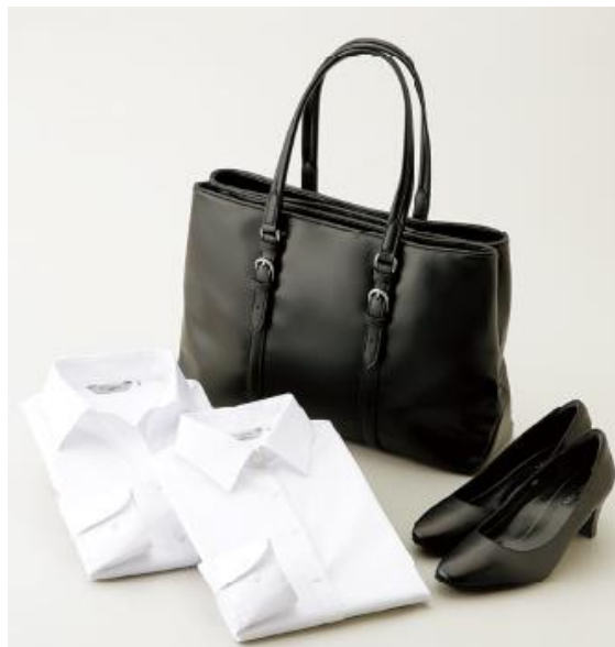
AOKI & マイナビ学生の窓口共同開発「究極の就活シリーズ」 ブラウス、パンプス、バッグ