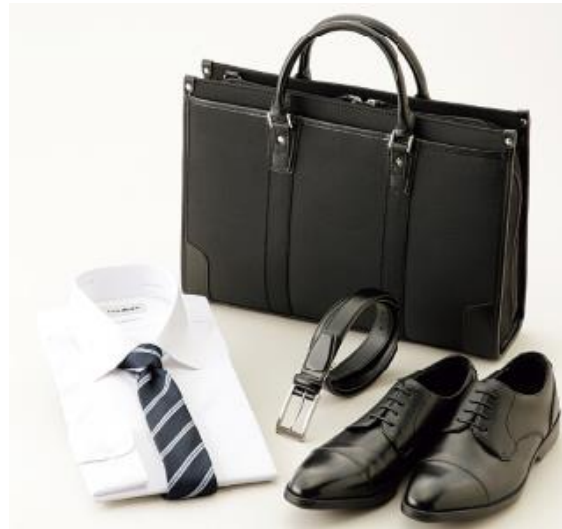
AOKI&マイナビ学生の窓口共同開発「究極の就活シリーズ」 シャツ、ネクタイ、ベルト、シューズ、バッグ