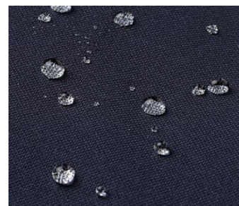
優れた撥水性を持つ「MINOTECH®」