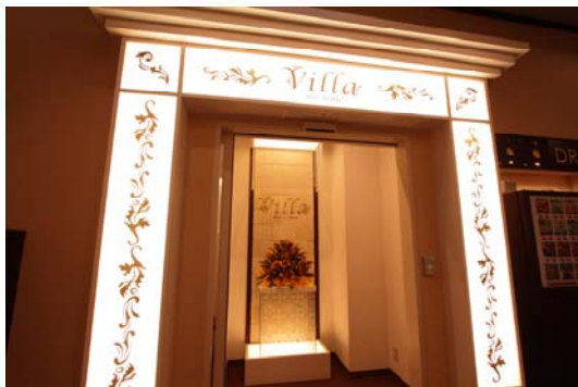
セキュリティーゲート

共有スペースとセキュリティーゲートで分けられた女性専用エリアは白を基調とした明るく清潔な空間です。今までのインターネットカフェのイメージを払拭する「女性だけの安心空間」をご用意しました。待ち合わせ前のメイク直しや時間調整にご活用いただけます。また、読みたかったマンガを思いっきり読む、観たかった映画や動画を思いっきり観る、など周りを気にせずに自分だけの時間をお過ごしいただけます。